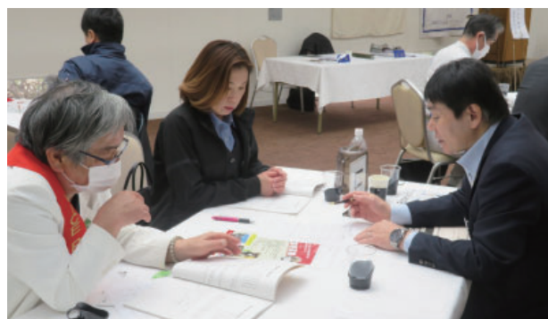
青少年奉仕委員会