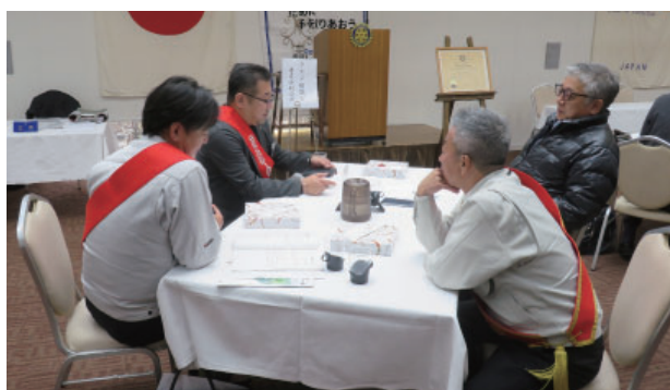
会員増強委員会・奉仕プロジェクト委員会