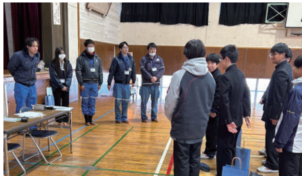
森井会員【オペレーターという仕事】