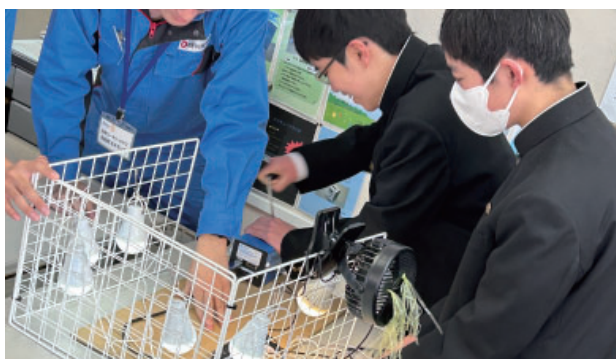
石野会員【電気をつくる仕事～わたしたちのくらしを支える電気～】