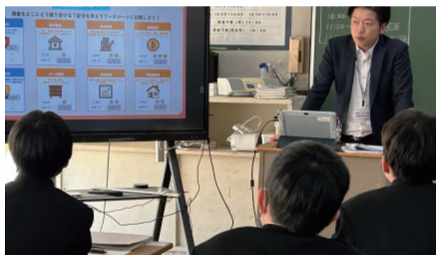
山口会員【わたしのライフデザイン】～みらいとつなぐ