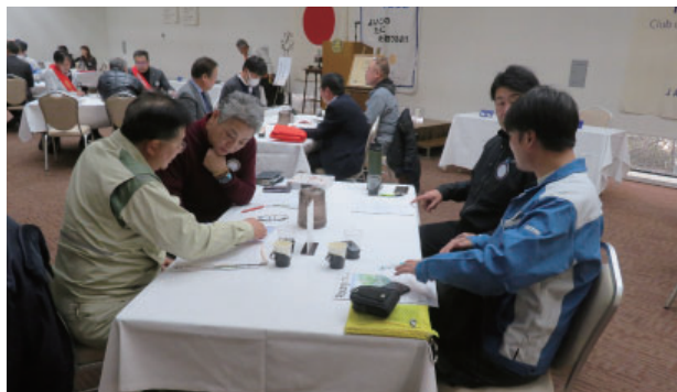
公共イメージ向上委員会・職業奉