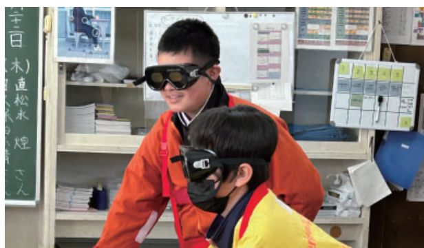
永蔭会員【病院のお仕事とリハビリについて】