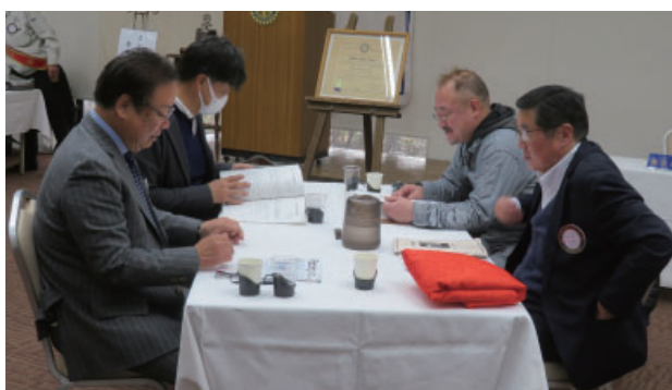
社会奉仕委員会・R財団委員会