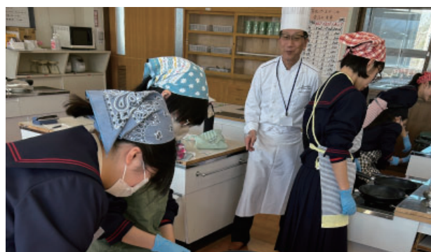
早見会員【テーブルマナー&美味しいステーキの焼き方】