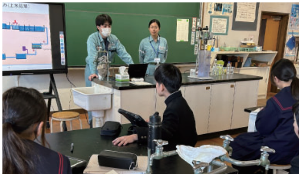
鳥取会員【水をきれいにする仕事】