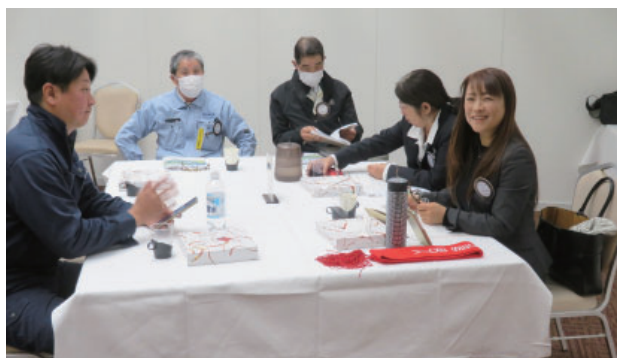
国際奉仕委員会・米山記念奨学会委員