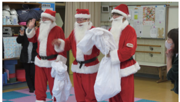
歳末助け合い募金(R7.12.25)